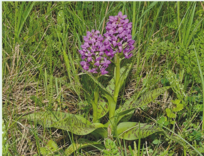
Aufblühende Dactylorhiza majalis

Lippe, die breiter als lang ist. Die Lippe hat eine dunkelrote Schleifenzeichnung. Der Sporn ist relativ dick, konisch und schwach abwärts gebogen. Nektar wird Insekten nicht angeboten (Nektartäuschblume). Der Austrieb erfolgt im zeitigen Frühjahr und die Blüte beginnt je nach Höhenlage Anfang Mai bis Anfang Juli.