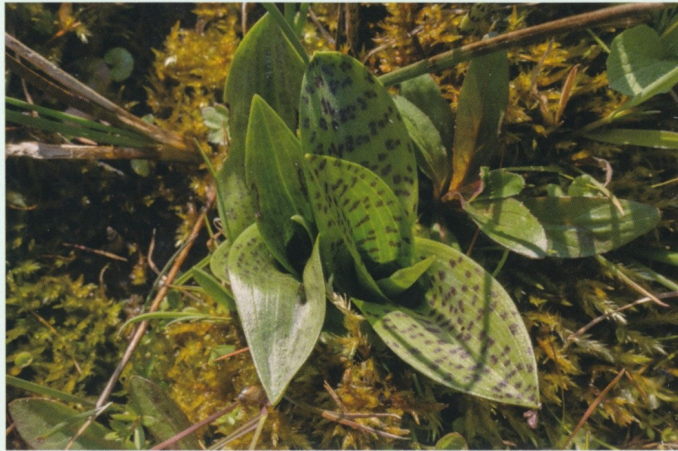
Austrieb Dactylorhiza majalis

Aus einer fingerförmig geteilten Knolle treibt ein 20 bis 50 cm hoher Stängel. Er ist dick und hohl und im oberen Bereich kantig. Die Blätter sind länglich-eiförmig und meist oberseits gefleckt. Sie erreichen den Blütenstand. Die Tragblätter sind breit und deutlich länger als die Blüte. Die untersten Blüten öffnen vor Streckung des zuerst pyramiden-, dann walzenförmigen Blütenstandes. Sie sind hell- bis dunkelpurpurn gefärbt, mit einer dreilappigen