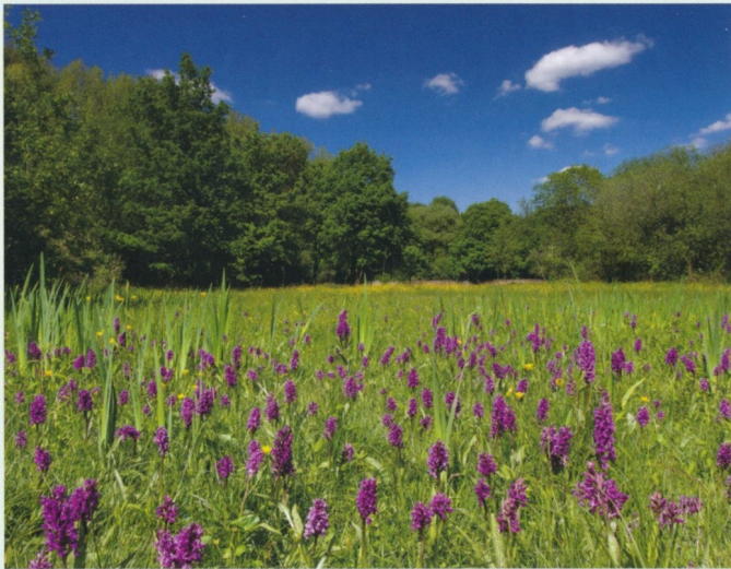
Nasswiese mit Dactylorhiza majalis

Die Arbeitskreise Heimische Orchideen der Bundesrepublik Deutschland haben für das Jahr 2020 das Breitblättrige Knabenkraut ( Dactylorhiza majalis ) zur Orchidee des Jahres gewählt, um auf die besondere Gefährdung des Lebensraumes dieser Orchidee hinzuweisen.